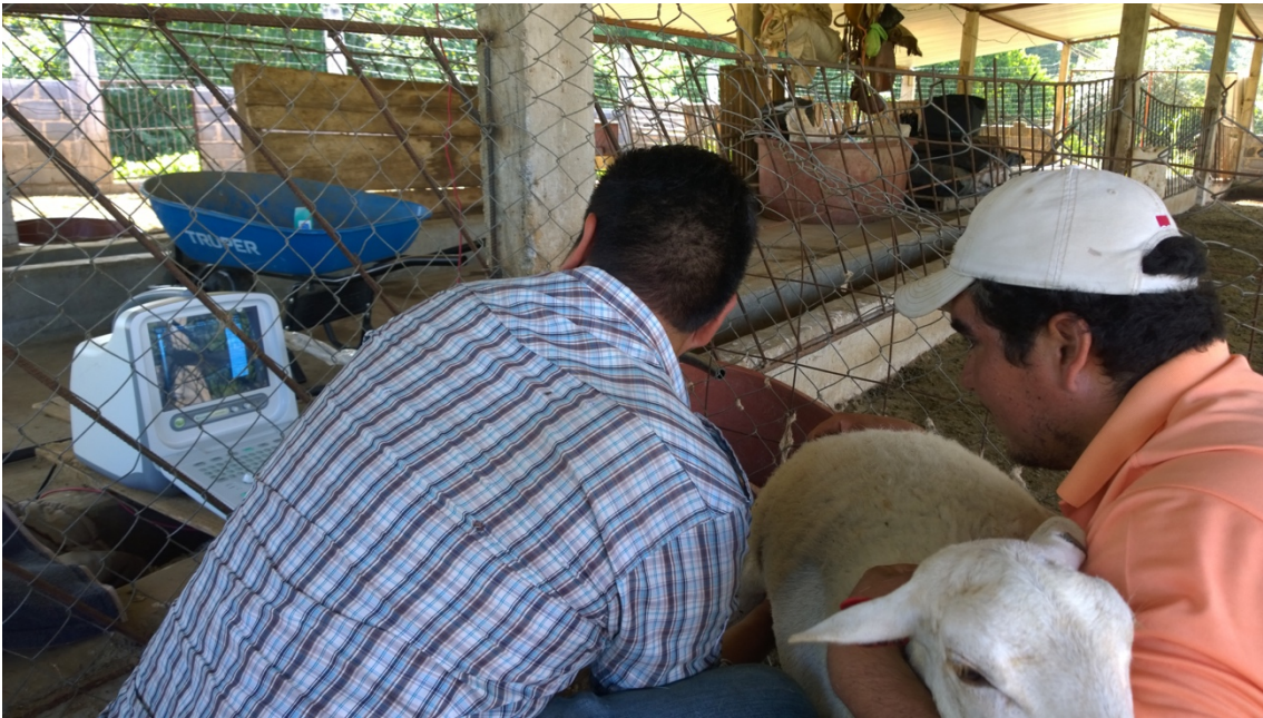
Figura 10. Diagnóstico de gestación en ovejas Pelibuey blanco.

Porcentaje de partos (PP): Se determinó mediante el conteo de ovejas que finalizaron la gestación en el parto, para lo cual, se utilizó la siguiente formula: