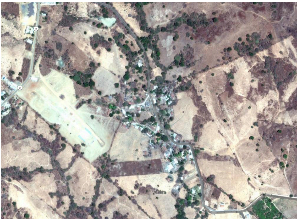
Figura 1. Ubicación de la comunidad Salitre de López, en la Región Sur del estado de México.

El experimento se realizó en el rancho La Esperanza, ubicado en San Pedro Limón, el cual se localiza en el extremo suroeste de la entidad del municipio de Tlatlaya, estado de México (Figura 1). Se encuentra a 660 metros de altitud sobre nivel del mar, y el clima predominante es tropical subhúmedo con lluvias en verano (INEGI, 2010).