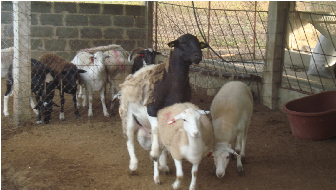
Figura 9. Monta natural dirigida a las ovejas detectadas en estro con semental raza Dorper.

Las ovejas que mostraron estro fueron servidas mediante monta natural dirigida, 24 h posteriores a la detección del estro, con un semental de fertilidad probada, raza Dorper (Figura 9).