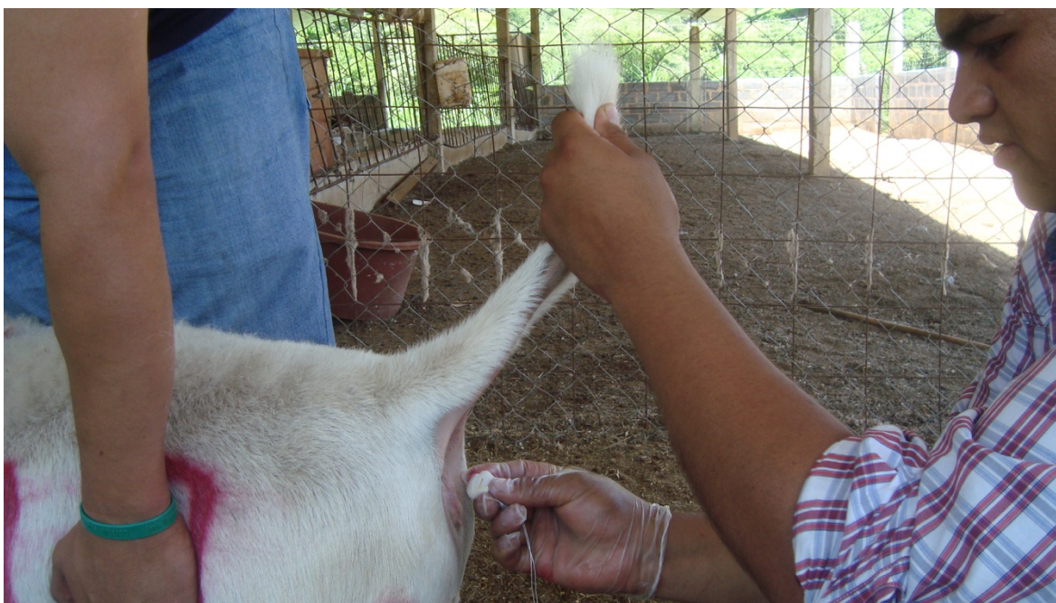
Figura 5. Ovejas con colocación de dispositivo intravaginal con progestágeno.

Todas las ovejas recibieron similar alimentación, buscando cubrir sus requerimientos nutricionales. La relación forraje:grano fue 60:40, la cual fue balanceada según las recomendaciones del NRC (2007).