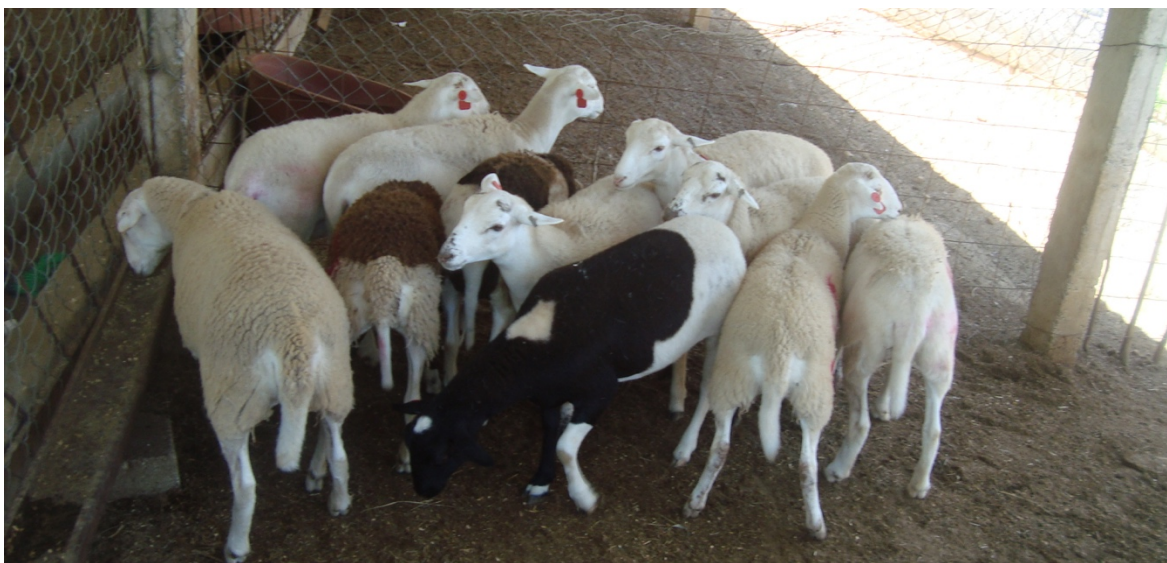
Figura 3. Ovejas primíparas, Pelibuey blanco, utilizadas como unidad experimental.

Se utilizaron 14 ovejas primíparas de la raza Pelibuey blanco (Figura 3), con una edad y un peso promedio de 8 meses y 40 kg (Figura 4), a las cuales se les colocó un dispositivo intravaginal con progestágeno (Figura 5).