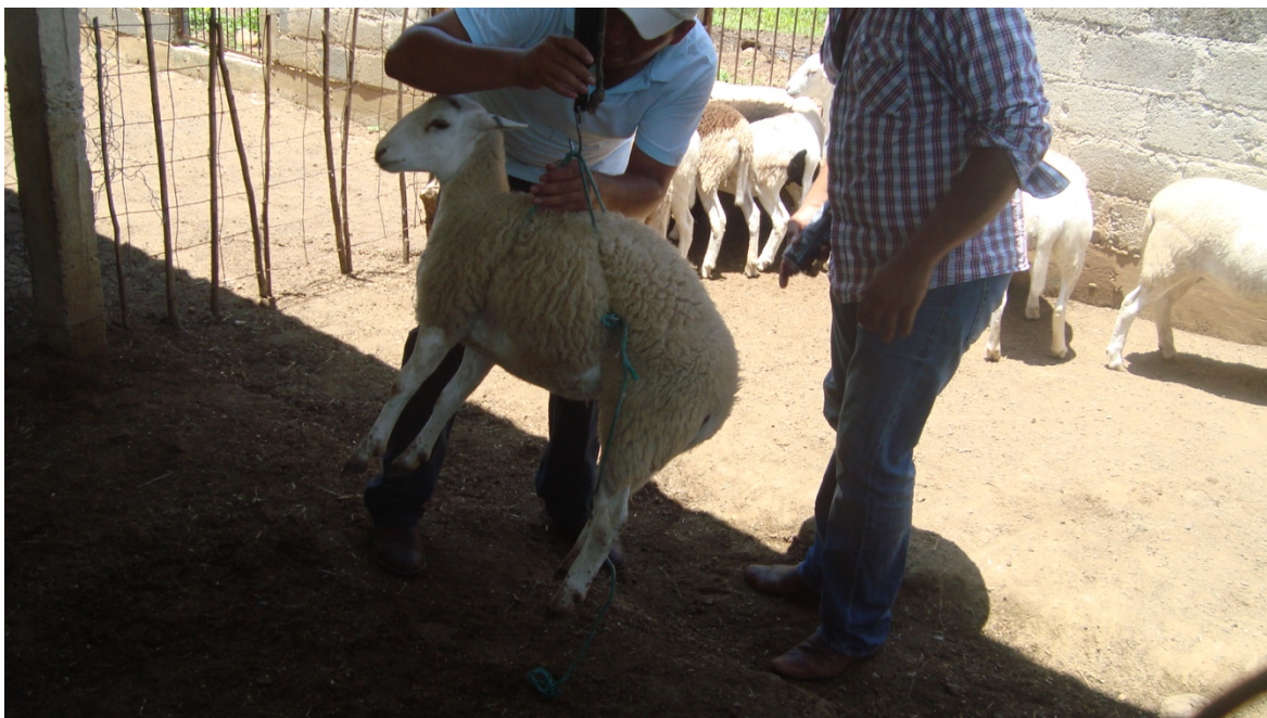
Figura 4. Pesaje de los semovientes empleados en el experimento.