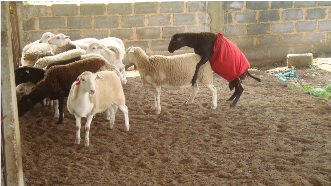
Figura 8. Detección del estro en ovejas primíparas con estro sincronizado.

La detección del estro se realizó durante 48 h, iniciándose 24 h posteriores al retiro de la esponja y después cada 17 d, durante dos ciclos estruales consecutivos (Figura 8).