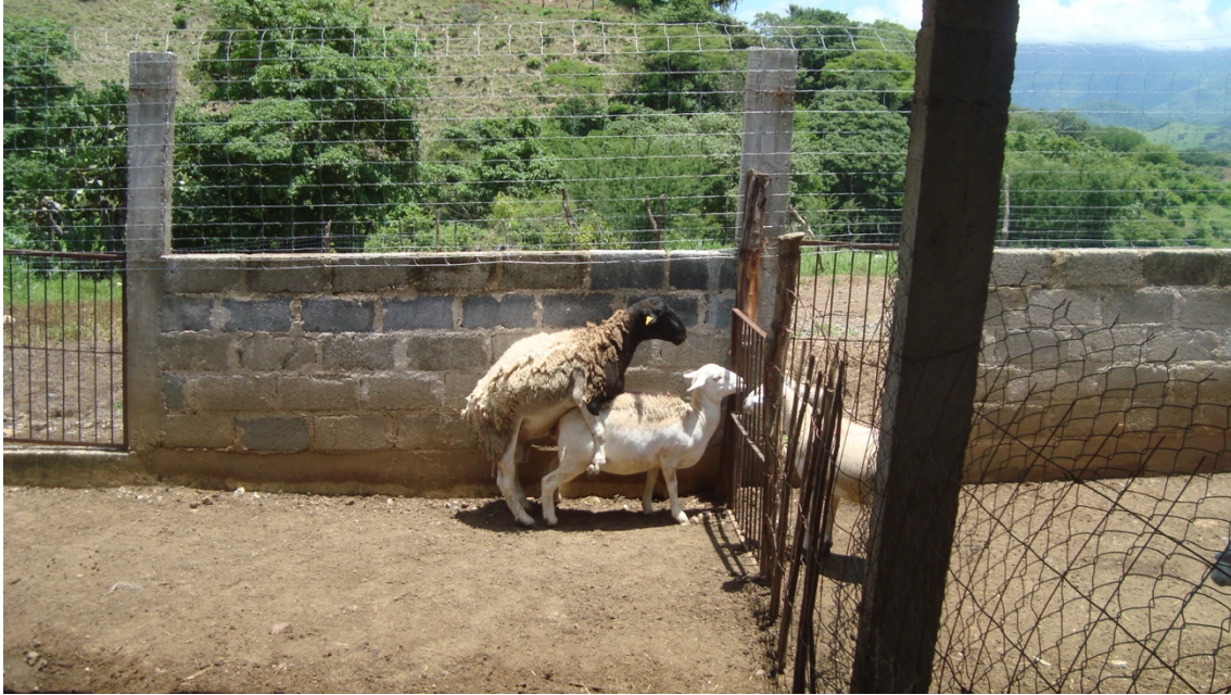
Figura 7. Monta natural dirigida, realizada 24 h posteriores a la detección del estro.