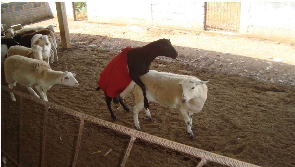
Figura 6. Macho provisto de un mandil, para evitar la cópula, realizando la detección de ovejas en estro.

Veinticuatro horas posteriores del retiro de los dispositivos intravaginales, se realizó la detección del estro, mediante la introducción de un morueco, al cual se le colocó un mandil con la finalidad de evitar la cópula (Figura 6). Las ovejas fueron registradas y separadas del rebaño, para ser servidas a las 24 horas posteriores de la detección del estro mediante monta natural dirigida (Figura 7).