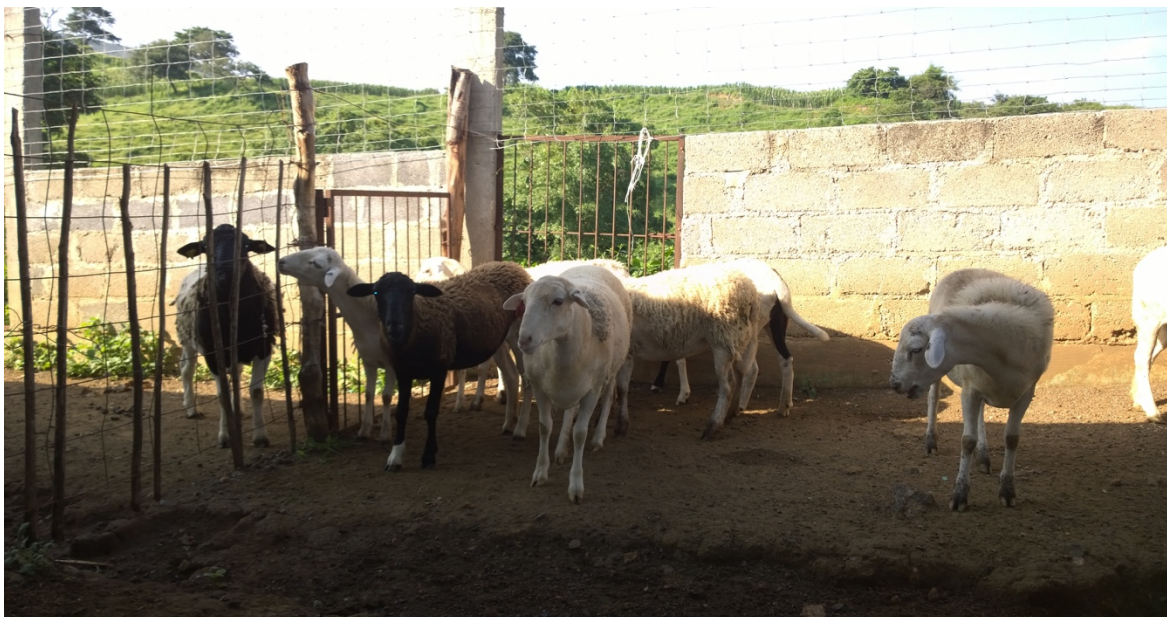
Figura 2. Ovinos presentes en los sistemas de producción de la comunidad de San Pedro Limón, en la Región Sur del estado de México.